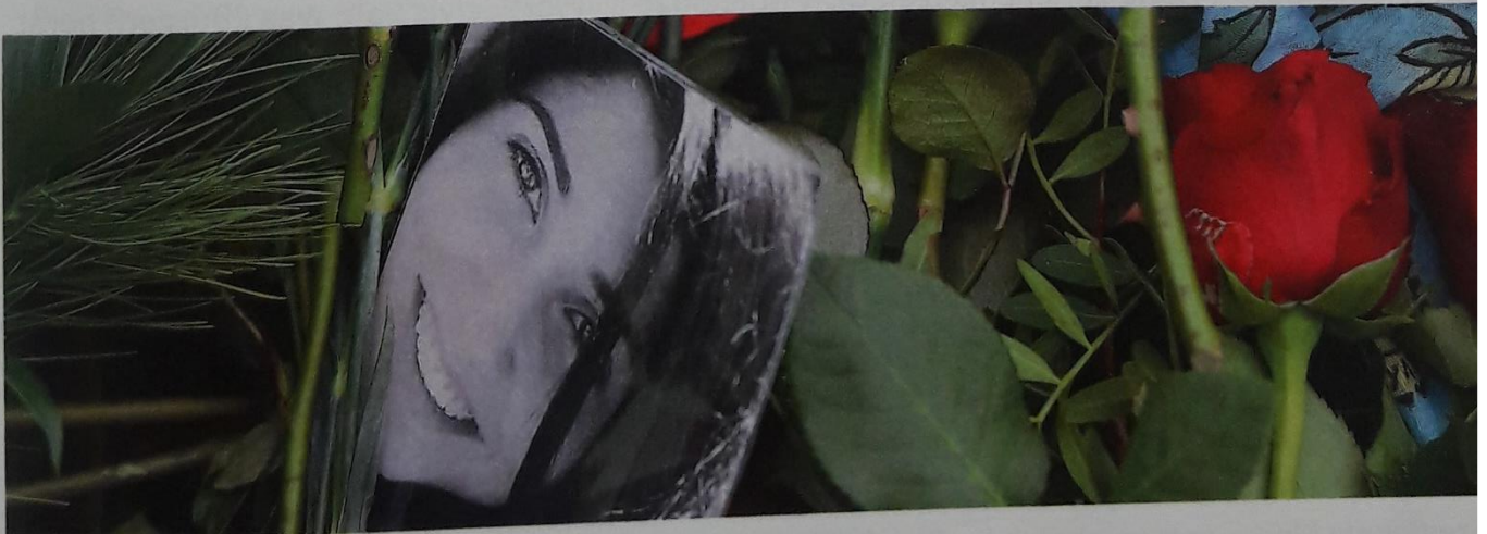
Grab der getöteten Studentin Tugçe Albayrak

(Kommentar: Lisa Mayr, 01.12.2014, © derstandard.at/200000886170/Der-Fall-TuGce-A-Zivilcourage-hat-immer-recht – © STANDARD Verlagsgesellschaft m.b.H 2015)